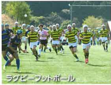
ラグビーフットボール