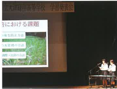
日置「マコモタケの栽培と活用 ～地域に活力を提案～」