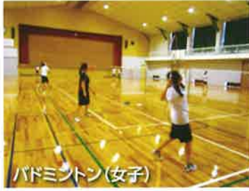
バドミントン(女子)