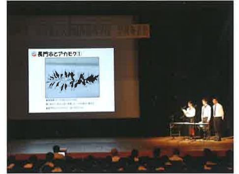
水産「ふるさとながと緑化プロジェクト ～アカモクの増養殖と商品開発～」