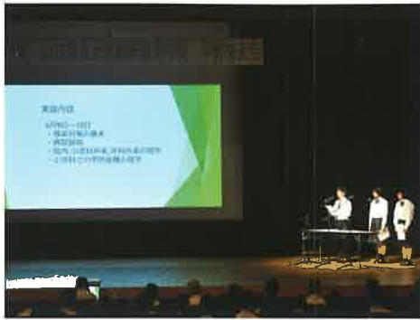
大津「職場体験報告」