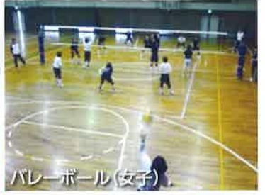
バレーボール(女子)